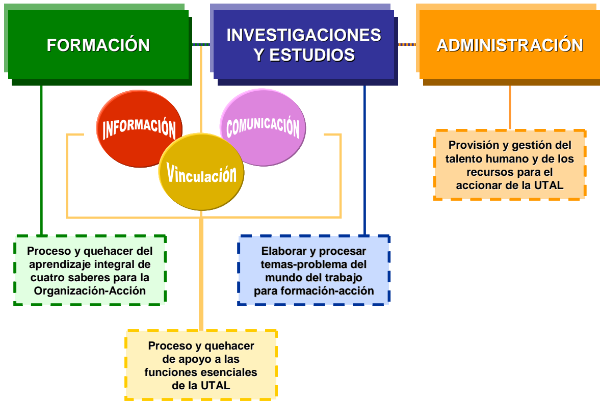
Figura N° 1