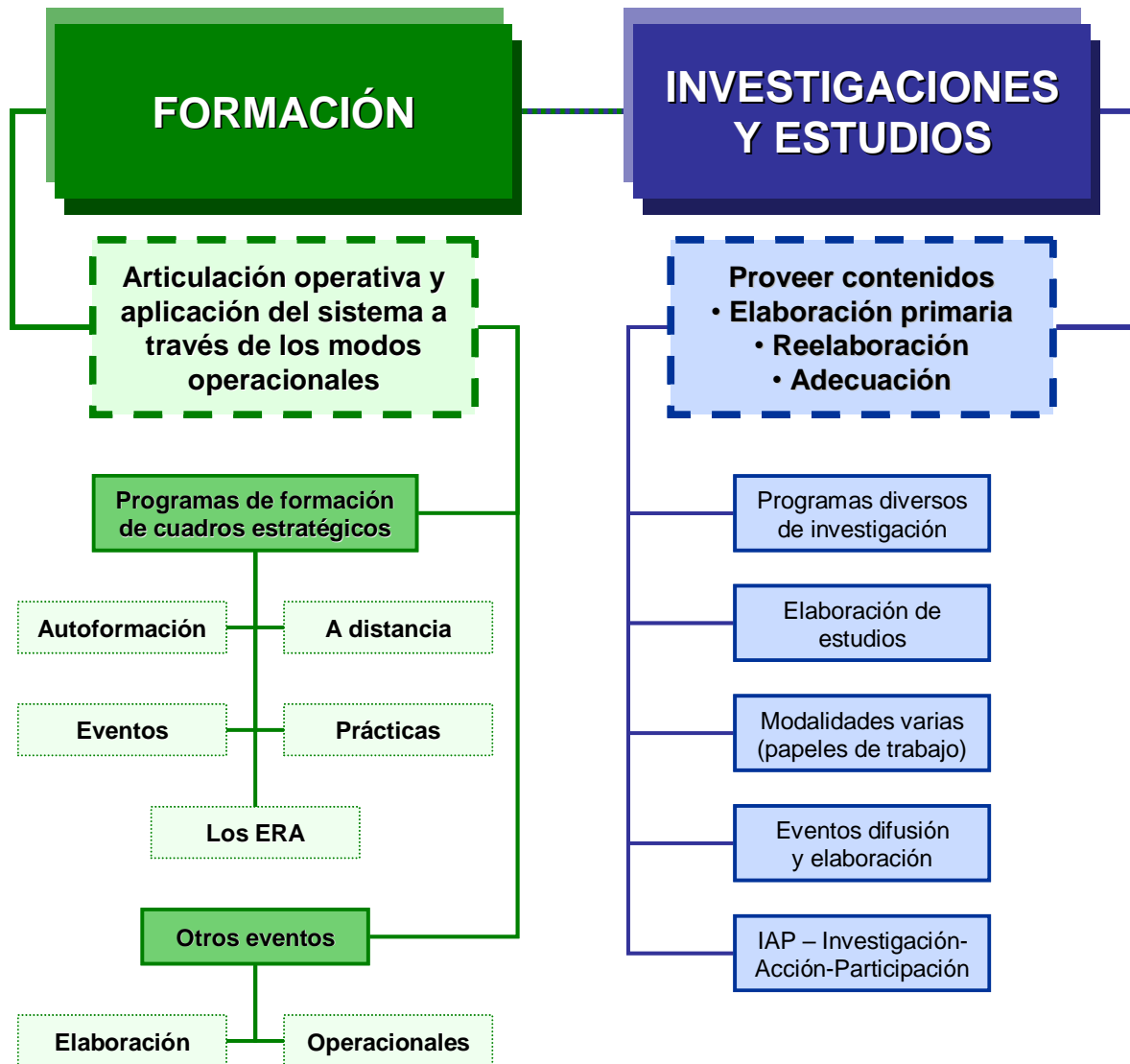
Figura N° 2